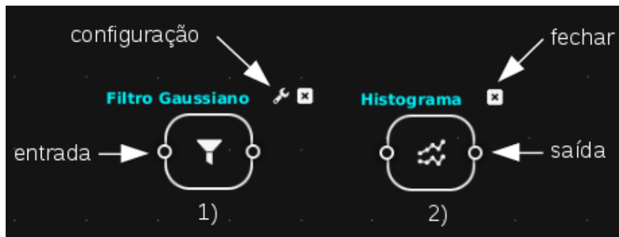
Figura 3: Estrutura básica de um nó

Os nós seguem a seguinte estrutura abaixo: