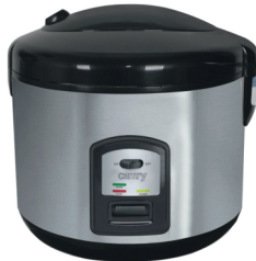
Rice cooker CR 6407