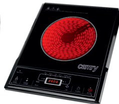
Ceramic cooker CR 6506