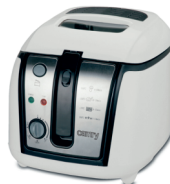
Deep fryer CR 4907