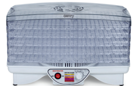
Food dryer CR 6653