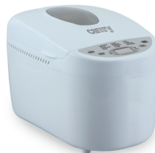
Bread maker CR 6012