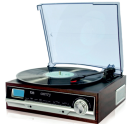
Turntable with radio CR 1113