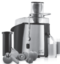
Juice extractor CR 110