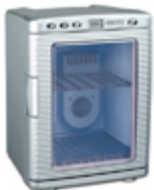
Mini-fridge CR 8062