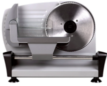
Meat slicer CR 4702