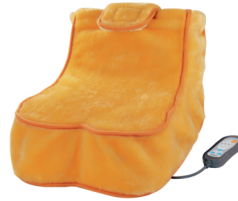
Heating and massage shoe CR 7411