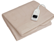
Electric blanket CR 7407