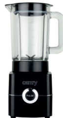
Blender CR 4050