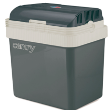
Portable cooler CR 8065