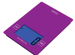
Electronic kitchen scale CR 3149