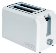
Toaster CR 3209