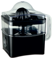
Citrus juicer CR 4001