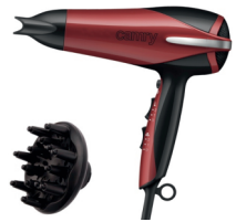
Hair dryer CR 2241