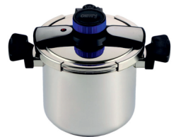
Pressure cooker CR 6726