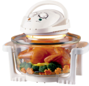
Halogen oven CR 6305