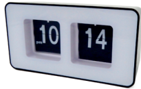
Auto-flip clock CR 1131