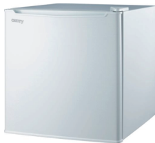
Aggregate refrigerator CR 8064