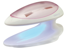
Manicure set CR 2151