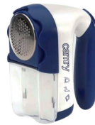
Lint remover CR 9606