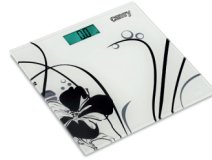
Electronical bathroom scale CR 8118