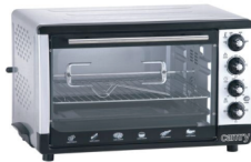
Electric oven CR 111