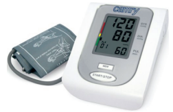
Arm blood pressure monitor CR 8409