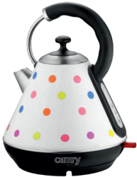
Electric kettle CR 1243