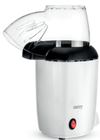
Popcorn maker CR 4458