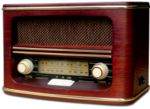
Retro radio CR 1103