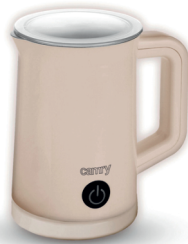
Automatic milk frother CR 4464