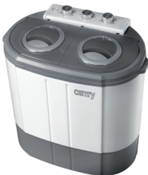
Washing + spinning machine CR 8052