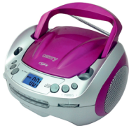
CD/MP3 player (boombox) CR 1123