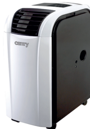
Air conditioner CR 7902