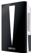
Air dehumidifier CR 7903