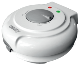
Cone maker CR 3028