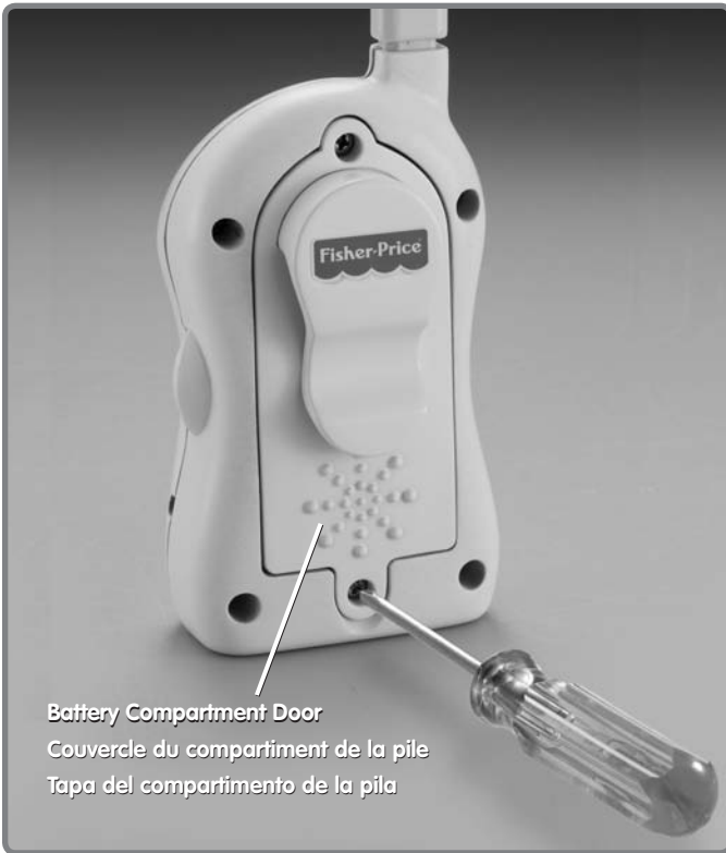
Battery Compartment Door Couvercle du compartiment de la pile Tapa del compartimento de la pila