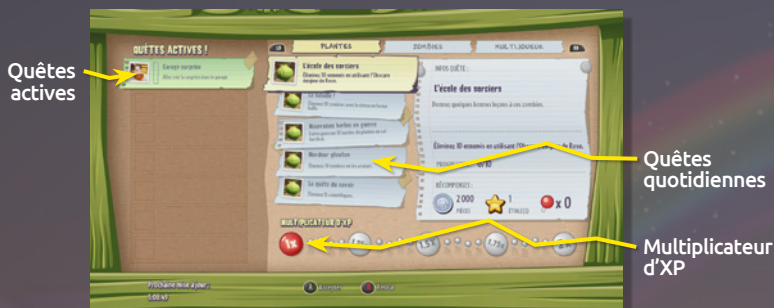
TABLEAU DES QUÊTES

Pour trouver des quêtes quotidiennes, consultez le tableau des quêtes dans les bases des plantes et des zombies. Les quêtes du tableau des quêtes sont disponibles pour une durée limitée et changent régulièrement. Cependant, toute quête active dans votre livre de quête reste disponible jusqu'à ce qu'elle soit terminée ou annulée. Parmi vos quêtes quotidiennes, vous pouvez obtenir une quête épique. Il s'agit d'une quête plus difficile, mais dotée d'une récompense conséquente (par exemple, une quantité exceptionnelle de pièces ou d'étoiles).