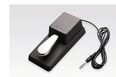
El pedal de damper F-10H