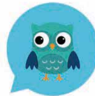
Phrases du Jour