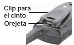
Clip para el cinto Orejeta

Coloque los clips para el cinto; para ello, deslice hacia abajo el clip. Para retirar el clip para el cinto levante la orejeta y deslice el clip hacia arriba.