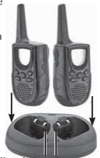
Indicadores de carga