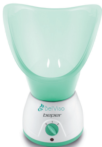
40.967N Facial Sauna and aromatherapy