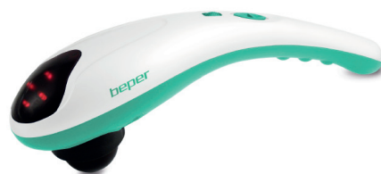
40.942 Body infrared massager