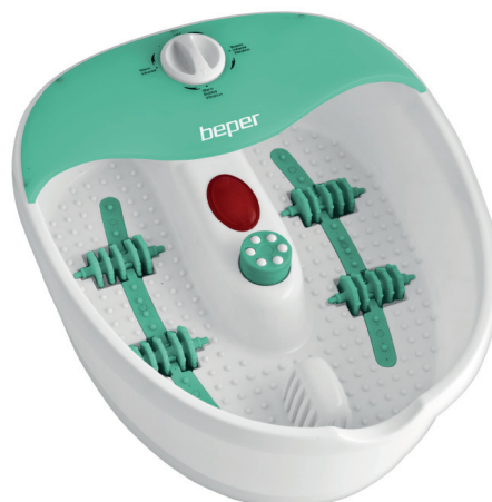
40.949 Foot massager