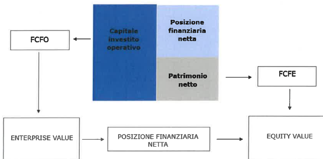
Figura 4: Prospettiva asset side vs prospettiva equity side

Flussi e tassi devono, ovviamente, essere tra loro coerenti. Pertanto, ad esempio: