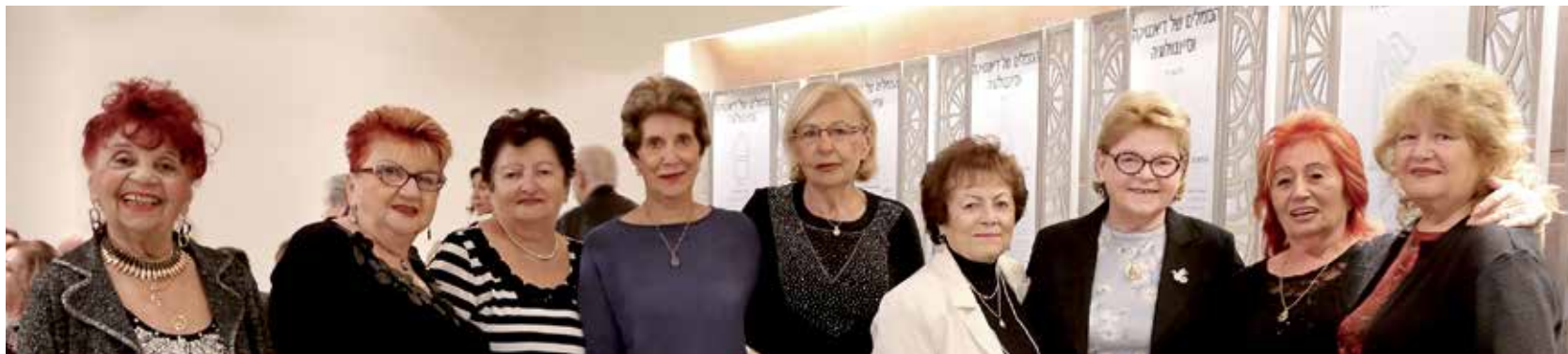
Din filiala Bat Yam au sosit la ziua Romaniei.