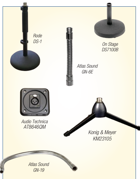
König & Meyer (K&M) Distribuído pela AKG Tripé miniatura de mesa p/ mic ( AKKM2311 )..... 15.00