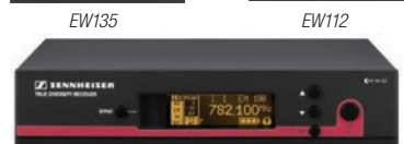
EM100 Receptor de Diversidade