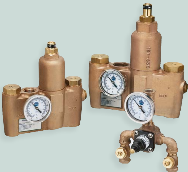
Válvulas de mezcla termostática Navigator de emergencia.

El diseño de las válvulas de mezcla termostática Navigator se adapta a casi todas las aplicaciones y se puede retroinstalar fácilmente en sistemas existentes, como la válvula que se muestra a continuación, instalada en una estación de recirculación de Philadelphia Eagles NovaCare Complex en Filadelfia, Pensilvania. Se eligió esa válvula por su capacidad para proveer de 18 a 756 litros (5 a 200 galones) de agua por minuto y mantener con precisión una temperatura preestablecida durante periodos cuando no se sacaba agua del sistema.