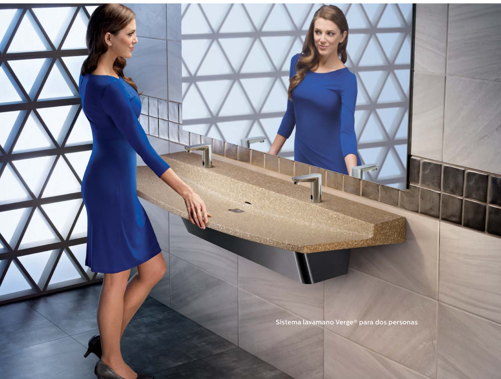
Sistema lavamano Verge® para dos personas

web, las mejores herramientas de asistencia (incluidos los modelos BIM Revit), la mejor documentación de especificaciones e instalación y un servicio de atención al cliente de clase mundial. Bradley ofrece una solución integral para todo tipo de baños, ya sean para pisos de fábrica, escuelas, restaurantes, comercios minoristas, recepciones de hoteles, gimnasios, terminales de aeropuertos, spas o instalaciones deportivas.