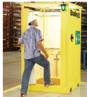
Ducha de seguridad serie SNA