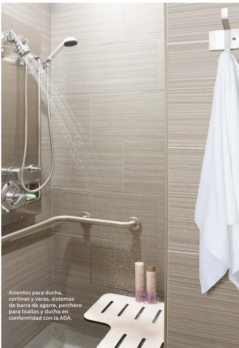
Asientos para ducha, cortinas y varas, sistemas de barra de agarre, perchero para toallas y ducha en conformidad con la ADA.