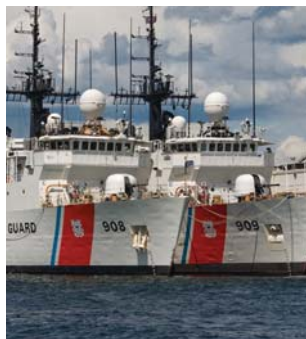
Industrial grande serie CNA