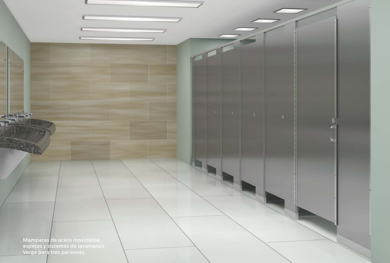
Mamparas de acero inoxidable, espejos y sistemas de lavamanos Verge para tres personas.