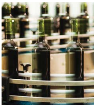
Industrial liviana serie CIN y C2N