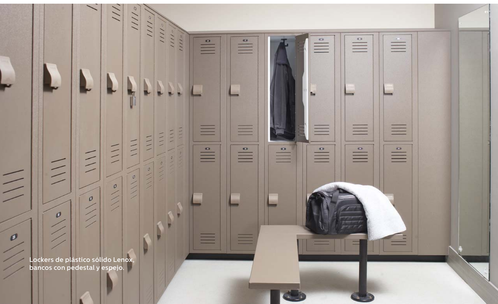
Lockers de plástico sólido Lenox, bancos con pedestal y espejo.