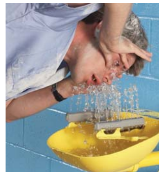
Lavaojos de emergencia serie CLE