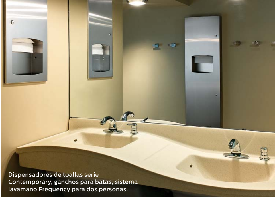
Dispensadores de toallas serie Contemporary, ganchos para batas, sistema lavamano Frequency para dos personas.

Bradley ofrece la más amplia gama de productos División 10 de la industria de baños con una línea completa de accesorios para baños, espejos, lockers y mamparas de baño. Con tantas opciones disponibles, nuestra oferta de productos le brinda libertad y creatividad más allá del presupuesto. En pocas palabras, solo en Bradley encontrará todo lo que necesita para equipar baños de División 10.