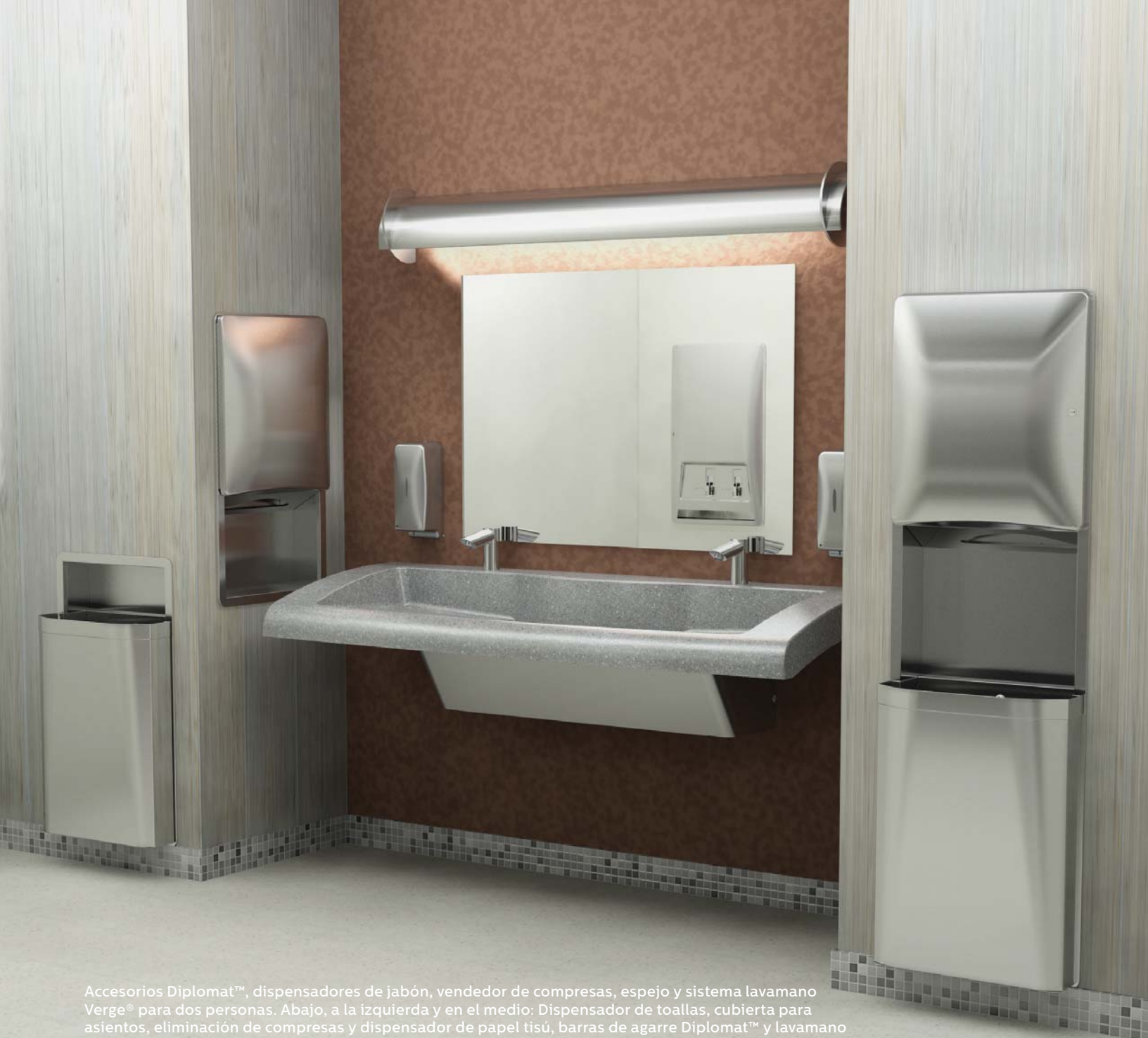
Accesorios Diplomat™, dispensadores de jabón, vendedor de compresas, espejo y sistema lavamano Verge® para dos personas. Abajo, a la izquierda y en el medio: Dispensador de toallas, cubierta para asientos, eliminación de compresas y dispensador de papel tisú, barras de agarre Diplomat™ y lavamano Verge® para una persona. Abajo, a la derecha: Secadores de manos Aerix® verticales, de dos lados.