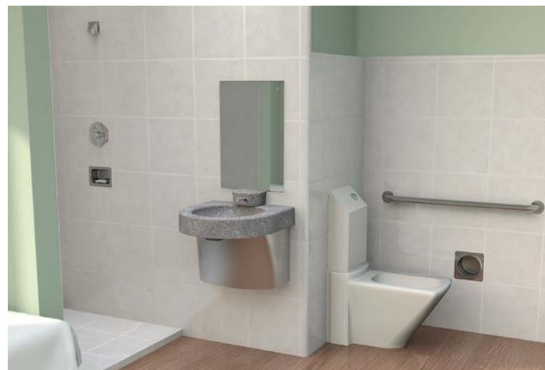
Arriba, a la derecha: los NUEVOS lavamanos empotrados serie HS son perfectos para habitaciones de pacientes, enfermerías y salas de examen. Abajo, a la derecha: Opciones de accesorios, duchas de pared y lavamanos resistentes a las ligaduras SafeCare, urinarios, unidades combinadas y duchas.