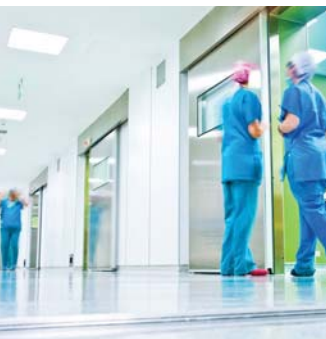
Comercial serie HL

controlador innovador cuenta con modulación completa, por lo que se usan solo los kilovatios necesarios. Los calentadores sin tanque de Keltech también ahorran espacio. Los calentadores de agua industriales con tanque grandes ocupan mucho espacio, mientras que los de Keltech solo requieren 0,3 metros cuadrados (3 pies cuadrados). Solo es necesaria una conexión eléctrica y agua para una fácil instalación, y no hay tanques, ánodos ni suavizantes que mantener. Los calentadores sin tanque de Keltech están disponibles para aplicaciones comerciales y de la industria liviana y grande, duchas de seguridad y lavaojos.