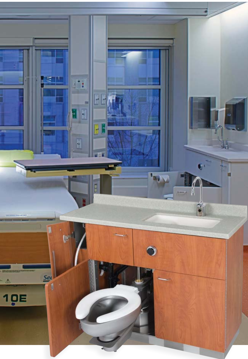
Unidades combinación LavCare con encimeras de superficie sólida no porosa de Terreon y TerreonRE.

Los NUEVOS lavamanos empotrados serie HS de superficie sólida con todo incluido ofrecen la flexibilidad para especificar equipos de plomería multi función estéticos y prácticos. La línea de productos SafeCare™ de Bradley resistentes a las ligaduras fue desarrollada con la colaboración de profesionales de la salud conductual para su uso en baños en situaciones de cuidados especializados. Las opciones de lavado de manos, duchas de pared y accesorios se adecuan a las habitaciones diseñadas para que los pacientes se sientan en un entorno más familiar, seguro y hogareño.