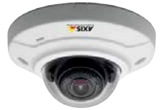
Serie AXIS M30. Cámaras para una vigilancia discreta en interiores.

Sus sucursales deben hacer frente a multitud de situaciones de riesgo, como atracos, vandalismo o fraudes, al tiempo que deben garantizar una excelente atención al cliente. En estos espacios de contacto directo con los clientes, resulta fundamental crear un entorno seguro, donde todo funcione a la perfección. Allí donde las necesite, podrá integrar las soluciones Axis y mejorar la seguridad, la eficiencia y el servicio.