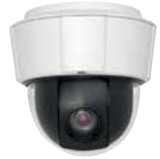
Serie AXIS P55. Cámaras de movimiento horizontal/vertical y zoom de última tecnología para interior y exterior

Teniendo en cuenta la importancia de los procesos internos de gestión necesarios para el buen funcionamiento de sus servicios bancarios y de corretaje, debe prestar una especial atención a los riesgos y la seguridad en los edificios de su empresa. Y, evidentemente, debe ofrecer también un entorno seguro y fiable a los ejecutivos, los trabajadores y los visitantes de sus instalaciones. Axis pone en sus manos un nivel de vigilancia a la altura de sus necesidades, desde la vigilancia del perímetro o la entrada principal hasta el control de acceso.