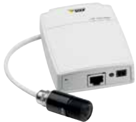
Serie AXIS P12. Cámaras HDTV para una vigilancia discreta.