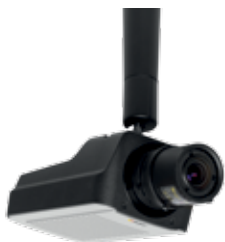
Serie AXIS Q16. Calidad de imagen excepcional en las condiciones más exigentes.