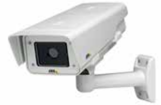
La serie AXIS P19 cuenta con detección fiable incluso en completa oscuridad

Tanto para ladrones como para trabajadores, las cámaras acorazadas representan un objetivo atractivo. Las soluciones de vídeo en red de Axis le ayudarán a disuadir a los posibles ladrones, que lo tendrán prácticamente imposible para evitar ser detectados. Gracias a las alertas integradas y a unas imágenes ultranítidas (del interior y el exterior), no se le escapará ningún detalle