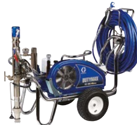
DUTYMAX™ EH300 HD PROCONTRACTOR