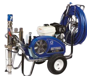
DUTYMAX™ GH300 HD PROCONTRACTOR