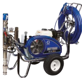
DUTYMAX™ EH230 HD PROCONTRACTOR