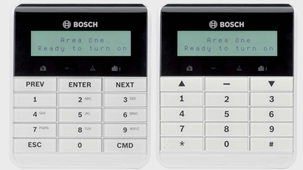
Clavier texte B915/B915i