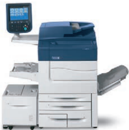
Xerox® C60/C70 con Alimentador de alta capacidad.