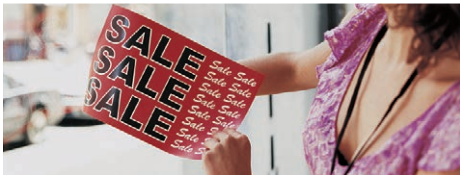
Carteles para ventanas Xerox® NeverTear

Con nuestro tóner de emulsión agregada especial de fusión extra baja de poliéster, la impresión se fusiona con el poliéster a través de una metodología de enlace químico propia. Esto asegura una calidad de imagen sobresaliente en medios especializados, como poliéster y demás. Nuestro tóner EA, que incluye Premium NeverTear, resiste agua, aceite, grasa y rotura.