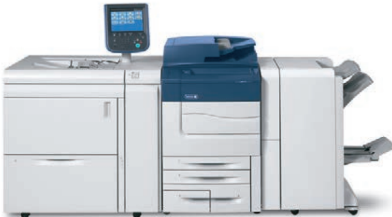
Xerox® C60/C70 con Alimentador de alta capacidad para tamaños grandes con una bandeja y Acabadora BR con generador de cuadernillos para la creación de cuadernillos.