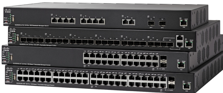
Figura 1. Switches administrados apilables Cisco de la serie 350X

Los switches Cisco de la serie 350X están diseñados para proteger su inversión tecnológica a medida que su empresa crece. A diferencia de los switches que pretenden ser apilables pero cuentan con elementos que se administran y reparan por separado, los switches Cisco de la serie 350X proporcionan funcionalidad de apilamiento verdadero, lo que permite configurar, administrar y resolver problemas de diversos switches físicos como si fueran un solo dispositivo, y expandir su red más fácilmente.