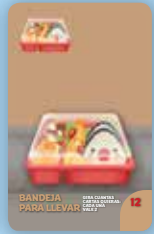
BANDEJA PARA LLEVAR

Consultad la «Guía de cartas» al final de este reglamento para conocer los pormenores de cada carta.